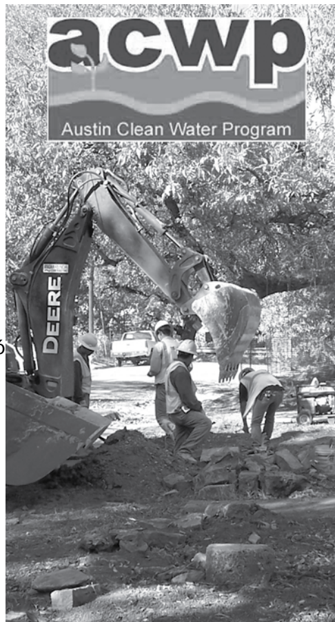
Trabajadores cavando zanjas para líneas de cloacas

El año pasado, el programa fue elegido por The International Right of Way Association como uno de los 10 mejores proyectos de infraestructura de Norte América en los últimos 75 años. La selección se basó en proyectos que han tenido "el mayor impacto en la calidad de vida de los Americanos."